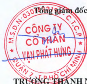
TRƯƠNG THÀNH NHÂN