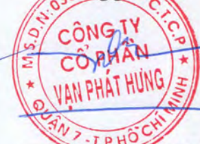
TRƯƠNG THÀNH NHÂN